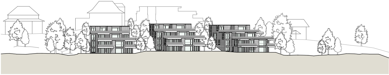
Westfassade _ Haus B,C & D_1:1'000