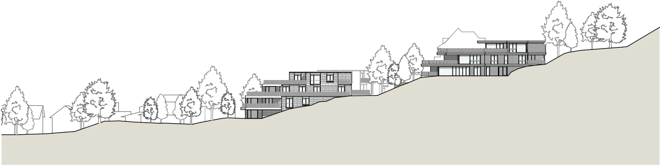
Südostfassade _ Haus A & D_1:1'000