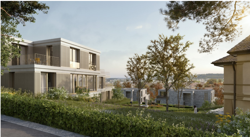
Visualisierungen maars architecture